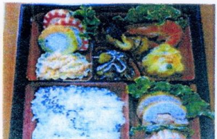
年越し 松花堂弁当